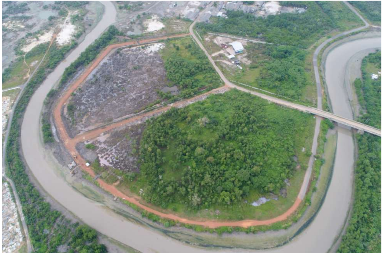
FOTO TAMPAK DRONE

NAMA : TANAH TELUK BAYUR LOKASI : KELURAHAN PASIR PUTIH KECAMATAN BUKIT INTAN LUASAN LAHAN : \pm 53.096\text{M}^2 KEPEMILIKAN : PEMERINTAH KOTA PANGKALPINANG SUMBER DATA : BIDANG ASET DINAS BAKEUDA